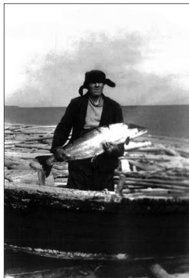
Cattura un grosso salmone

Anche la padrona di casa non dormiva, si sentiva come si rigirava inquieta, poi si alzò, borbottando piano qualcosa, venne da me in camera, facendosi il segno della croce a ogni tuono, scostò le tendine alle finestre, coprì col grembiule lo specchio, coprì coi cenci le parti in nickel del letto. Vedendo che non dormivo, cominciò a parlare più forte, e capii che pregava.