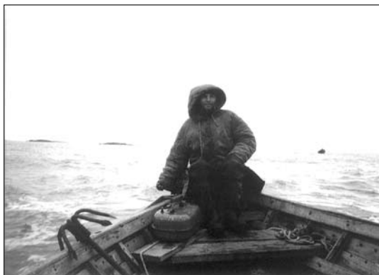
In barca verso l'accampamento Sosnovey

Navigammo tutto il giorno, passammo accanto a piccole izbe, ma le barche non erano state lasciate accanto a esse e andammo oltre. Il vento era contrario, era più difficile remare.